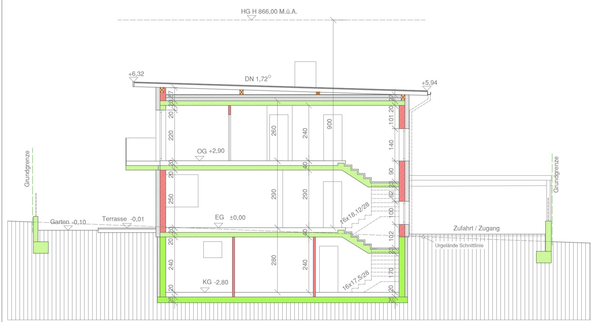
Schnitt HAUS B